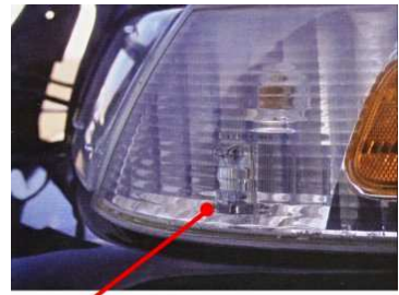
Ampoule à Led

L' ELUCK2, permet d'équiper un véhicule banalisé d'une signalisation lumineuse efficace et discrète et son générateur offre 30 modes de fonctionnement différents.